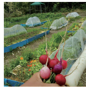
(写真)3月からスタートした神山町在住6組の畑「ノラ上手」はちよっぴり先輩、奥剣家庭菜園の会です!